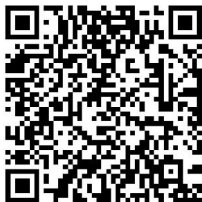
广西医学会急诊医学2023年学术年会 会议报名二维码