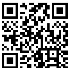
广西医学会精准医学2026年学术年会 报名二维码